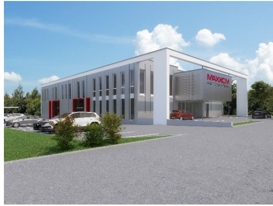
Abbildung 2: Das neu geplante Produktionswerk in Oberhofen